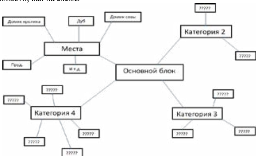
Схема 1. Кластерный метод

ватмана необходимо написать основную идею в рамочке «Ослик потерял хвост». Далее участники заполняют кластер и связанные с ним области, как на схеме.